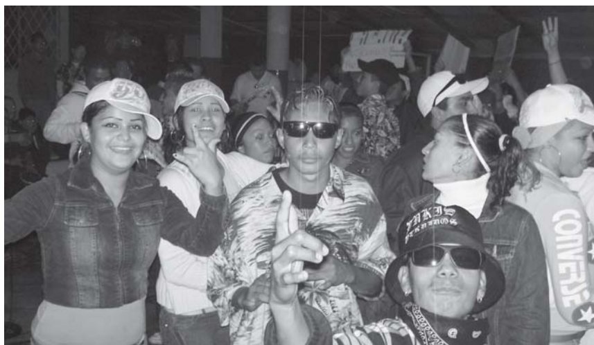
Baile de cumbia en Guadalupe.

Las identidades son actualmente materia de debate ri-