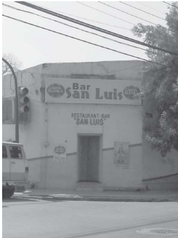
Un bar típico de la Independencia.

Los seguidores de la música colombiana ahora tienen nuevas opciones, en este momento saben que cada mes vendrá un grupo importante de Colombia