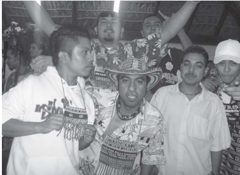
Jóvenes “colombias” de Monterrey, en el pecho llevan una bandera de Colombia con el nombre de su banda y de los integrantes. Fotos de Darío Blanco Arboleda, 2006.

Entonces ya se empezó a radiar todo el día y fue llegando El Binomio de Oro, Los Diablitos y hasta ahorita lo actual que es el vallenato... Pues gustó, gustó por la música las estaciones colombianas no; es un interés de raiting; o sea que al ver que la XEH [en] los lugares que está, surgieron las demás estaciones, pero no tanto, porque, por la cuestión de la música colombiana, sino por el raiting de audiencia. Están buscando simplemente un raiting... O sea yo fui el iniciador y durante veintitantos años yo luché por la música; o sea, nadie la tocaba porque no la querían... y era vallenato pero haga de cuenta que la estación, esa estación casi no marcaba raiting y con una hora que yo tenía, haga de cuenta que la estación comenzó a subir, y se empezó a oír, y ya la gente la empezó a conocer la XOK, la XOK... tocaba Celso Piña, La Tropa Colombiana,