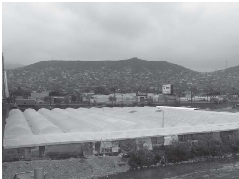
Vista del cerro de la Loma Larga, donde se ubica la colonia Independencia.

país y a difundir las versiones tropical y norteña hacia Estados Unidos de América.