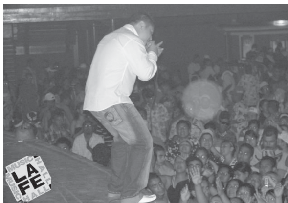
Presentación vallenata en La Fe Music Hall.

...Yo paré, haz de cuenta que cuando yo paré, fue porque este, empecé a trabajar La Fe (Music Hall). Empezó a traer los grupos, haz de cuenta que te quitaban, ya había más competencia. Haz de cuenta que yo dije: “Pos que caso tiene, o sea, mejor este pos ellos que se hagan ricos” ¿verdad?... pero porque vieron que había dinero, o sea, vieron que había mucha gente y donde quiera que, yo hice eventos aquí y me fui hacer eventos también hasta Santa Catarina o sea, rentaba las plazas iba al municipio y llevaba a La Tropa y ¡todo llenaba!, oye o sea ¡llenaba! ...Allá en Santa llegué a meter como 5 mil gentes... haz de cuenta que sí cambió, porque haz de cuenta que sí viene gente, pero ya no como antes, haz de cuenta que vienen 100, 200, 300 gentes es lo más que puede haber o sea ya no puede ir más gente ¿por qué? Porque la gente se espera, pues porque va haber un baile en La Fe entonces esperan, juntan, compran su reservado, más tranquilos, se van allá, se meten ahí a lo grande... Pues de repente los músicos de Colombia sí le han venido a quitar trabajo a los grupos de aquí de Monterrey. Porque nosotros vemos mal por ejemplo de los empresarios de grandes vea, por ejemplo de Multimedios que los está trayendo, todos los grupos ven mal, y yo también, yo, o